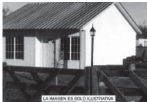
LA IMAGEN ES SOLO ILUSTRATIVA