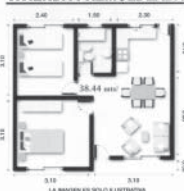
LA IMAGEN ES SOLO ILUSTRATIVA

Documentación a presentar tanto para el titular como para el/los garante/s: